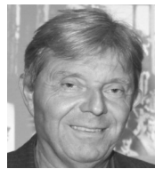
Ordföranden har ordet