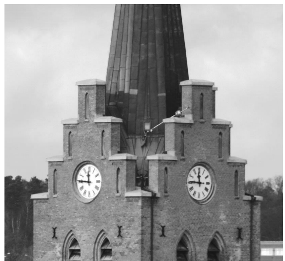
Stormen fick S:t Nikolais kyrktupp att pröva vingarna.