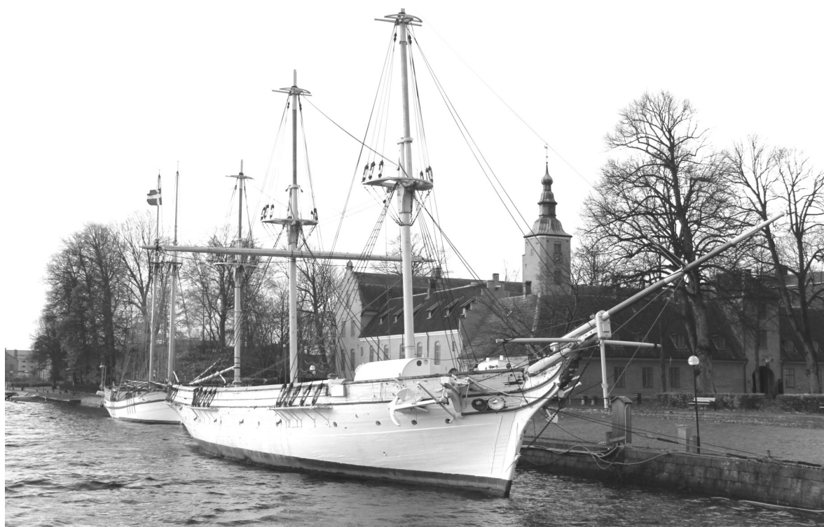
Stormarna Simone och Sven i höstas höjde vattenståndet i Nissan rejält. Najaden ser ut att vara på väg upp på kajen.